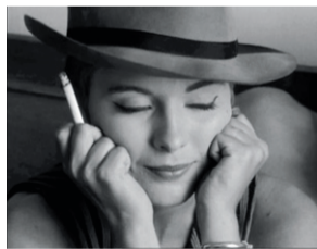
Jean Seberg : « à bout de souffle »